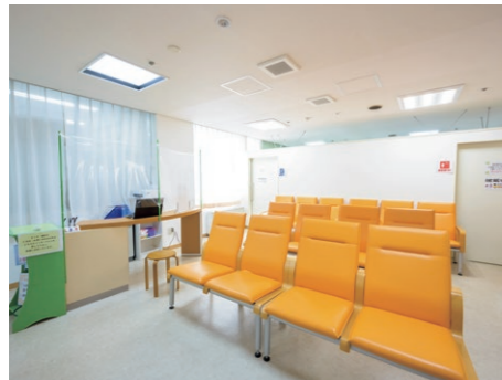
健診室 人間ドック、予防接種、各種健診を扱っており、稼働件数は年間約5,000件です。