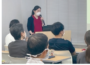
骨粗しょう症勉強会