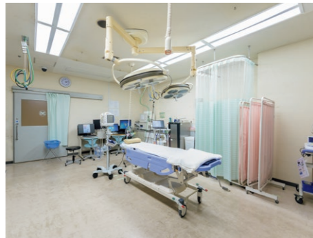
救急処置室 処置室1床、観察室3床で搬送受入を24時間体制365日対応しています。