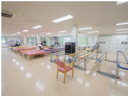
リハビリテーション 最新機器を備えた広々としたリハビリ施設です。ST室は5室完備しています。