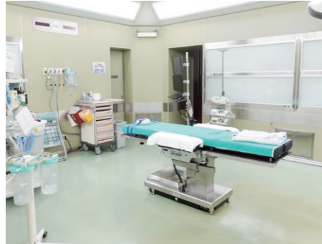
手術室 3室は外科系手術、1室は局所麻酔の眼科や血管シャントなどの小手術用の全4室です。

1Fは外来受付と診察、2Fには手術室やICU、透析室、健診室、その他治療室、3~5Fには入院病棟を配置し、治療や療養に応じた環境が整えられています。