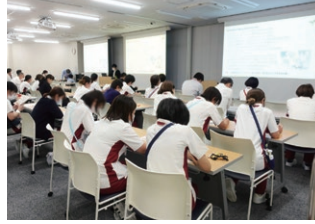
身体拘束ゼロ委員会研修