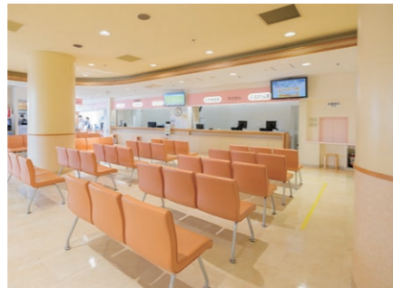
待合 A~C、整形待合、中庭をはさみ、検査エリアがあります。毎月13,000人の患者さんが受診しています。