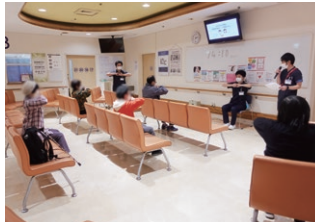
セコメいきいき健康教室