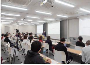
セコム研究発表会(院内予選)

定期的に各種勉強会を開催しており、スキルアップの機会がたくさんあります。特にセコム研究発表会は毎年セコム提携病院グループと関連会社合同で研究成果を発表し、当院は好成績の受賞歴があります。