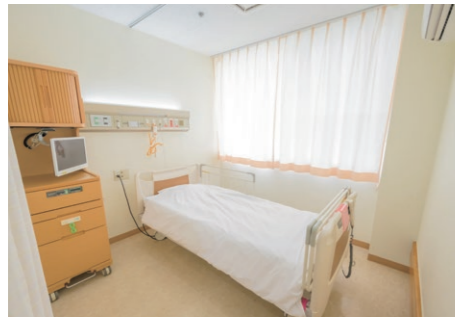
病室 大きな窓で明るく開放的な空間が広がります。4~6人部屋、個室24室(一部トイレ付)を完備しています。