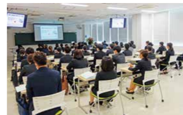
式後は病院とのリモートで感染対策・医療安全・5S活動・セキュリティ・外来受診の流れ・BCP防災などのオリエンテーションを実施

2021年4月1日の入職式は新型コロナウイルス感染症対策として密集を避けるため千葉中央看護専門学校にて行われました。今年度は医師6名、看護部27名、リハビリテーション部14名、薬剤部1名、放射線科2名、事務部2名の合計52名の新しい仲間が加わりました。院長より病院理念等の挨拶に気持ちも新たになった新入職員達でした。